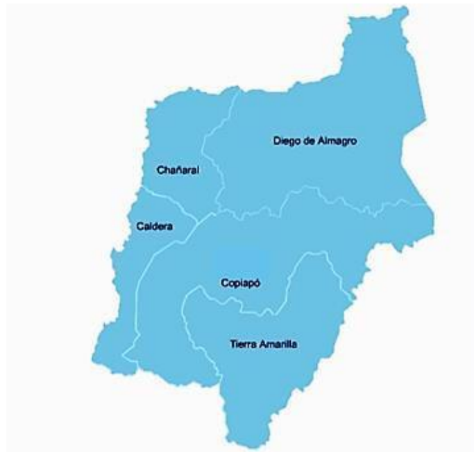
Figura 1. Mapa territorial SLEP Atacama.

educacionales. En la comuna de Caldera, se cuenta con 4 establecimientos educacionales urbanos, con 1 centro de educación de adultos, una escuela rural y 3 jardines VTF, con un total de 9 establecimientos educacionales. En la comuna de Chañaral, cuenta 7 establecimientos educacionales urbanos, un establecimiento de educación especial, uno en contexto de encierro. En la comuna de Diego de Almagro, se distribuye en 3 establecimientos educacionales urbanos, un CEIA y uno rural. En el territorio, la mayor concentración de establecimientos rurales se encuentra en la comuna de Tierra Amarilla (5), las cuatro comunas restantes, sólo presentan un establecimiento rural en cada una.